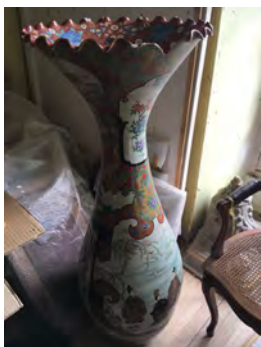
BRANTÔME POTICHE CHINOISE