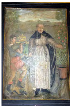
LA CHAPELLE-POMMIER SAINT FIACRE