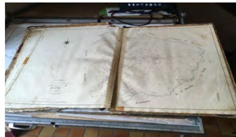
JAVERLHAC CADASTRE NAPOLÉONNIEN